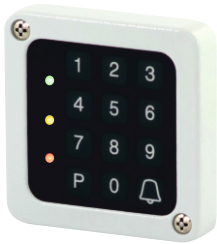
Tastenfeld mit LED - Beleuchtung