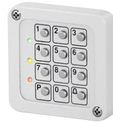
Tastenfeld mit LED - Beleuchtung